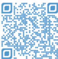
USV Eaton 9PX