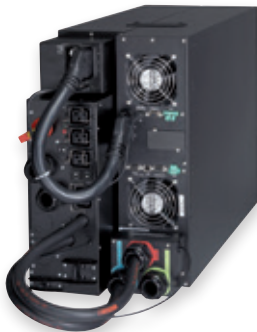
Eaton 9PX 11kVA mit Wartungsbypass

Die 9SX ist eine Energy Star® qualifizierte USV