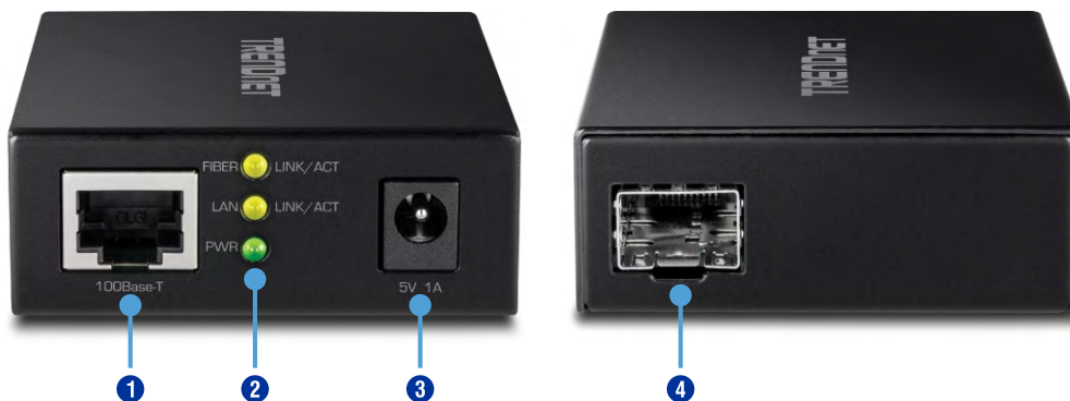
Illustration Eines Network

Kleines, kompaktes Metallgehäusedesign für mehr Flexibilität bei der Installation.