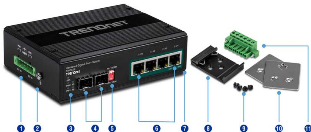
Illustration Eines Network

Stabiles IP30 Gehäuse hält hoher Stoß- und Vibrationsbelastung stand; ESD / EMI / Überlastschutz; geeignet zum Gebrauch in einem breiten Temperaturbereich (-40 – 75 °C (-40 - 167 °F)).