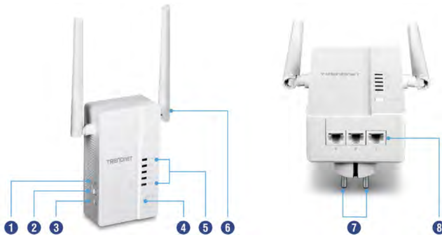
Illustration Eines Network

Mit der WPS-Taste Ihres Routers und der Wi-Fi Clone Taste des TPL-430AP können Sie den Netzwerknamen und das Passwort Ihres bestehenden Netzwerks praktisch für schnelle Netzwerkintegration kopieren.